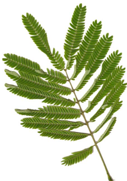
Detalle de una hoja

Etimología: El género está dedicado al noble florentino Filippo degli Albizzi, quien introdujo la especie desde Constantinopla hasta Europa a mediados del siglo XVIII. El epíteto específico julibrissin procede de su nombre persa gul-i abrishum , que significa flor de seda. Los nombres populares hacen alusión a sus lugares de procedencia, a su porte aparasolado o a la apariencia sedosa de los estambres de sus flores.