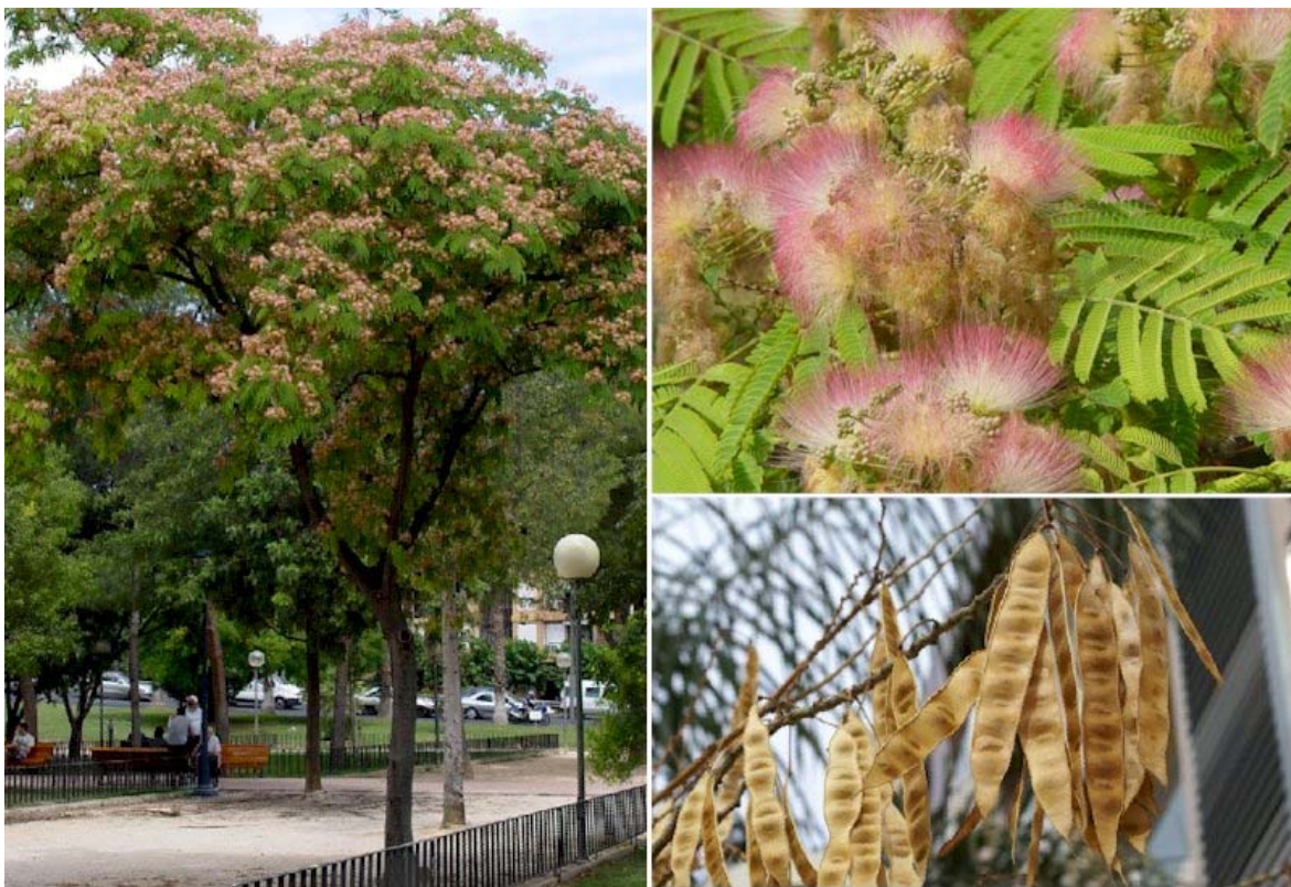
Aspecto general y detalle de las flores en Junio y detalle de los frutos en Enero

Nombre común: acacia de Constantinopla, árbol de la seda, parasol chino.