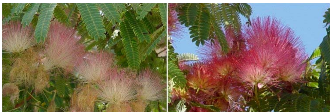
Color de las flores en la forma habitual y en el cultivar 'Umbrella'

Localización: Especie cada día más abundante en jardines y en algunas alineaciones. En Murcia podemos ver un buen ejemplar de copa aparasolada en la Plaza Condestable y otro de copa redondeada, algo menor, junto al Puente de los Peligros. También los hay en el Jardín del Malecón y en jardines de nueva creación en Ronda Sur, junto al Paseo de Florencia o en Santiago y Zaráiche.