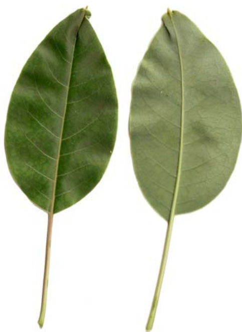
Detalle de una hoja. Haz y envés

hojas, de 7,5-15 cm de largo y hasta 2,5 cm de diámetro, con flores unisexuales que se disponen en pies separados, sobre pedicelos de 2-5 mm de largo. Flores masculinas con 5 tépalos, persistentes, de ovados a elípticos, de unos 3,5 mm de largo, blanquecinos; androceo con 20-30 estambres, libres, exertos, dispuestos en 2 series irregulares, con los filamentos de dos tamaños, los más