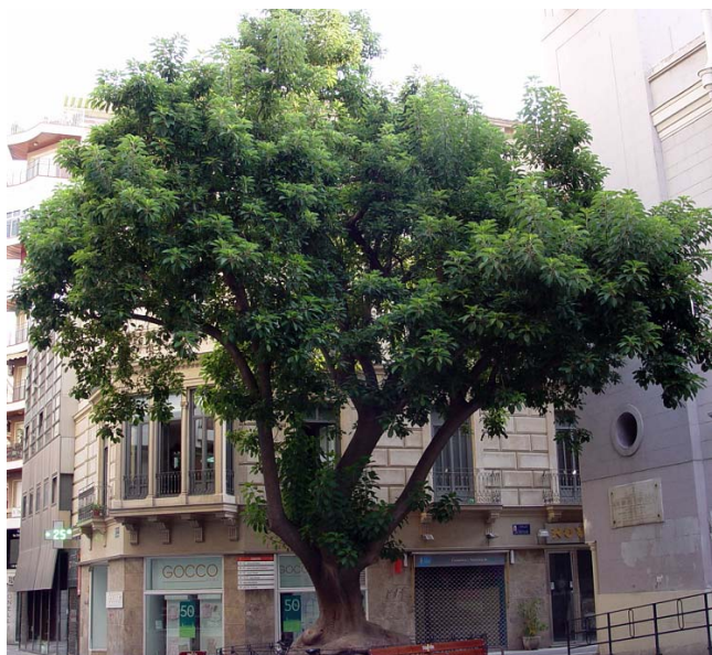
Ombú de la Plaza San Bartolomé

cortos de 1-2 mm y los más largos de 5-7 mm; anteras oblongas, de 1,5-2 mm; pistilodio u ovario rudimentario presente. Flores femeninas con 5 tépalos, caedizos, de ovados a elípticos, cóncavos, de unos 4 mm de largo, blancos; estaminodios alrededor de 10; ovario súpero, globoso, con 7-12 carpelos unidos en su base; estilos recurvados, libres, muy cortos. Infrutescencias de 15-20 x 2,5-3 cm, con numerosas bayas deprimido-globosas, con surcos entre las semillas, de 0,8-1 cm de diámetro, amarillentas, tornándose negruzcas en la completa madurez; semillas ovoide-comprimidas, de unos 3 x 2 mm, de color negro brillante.