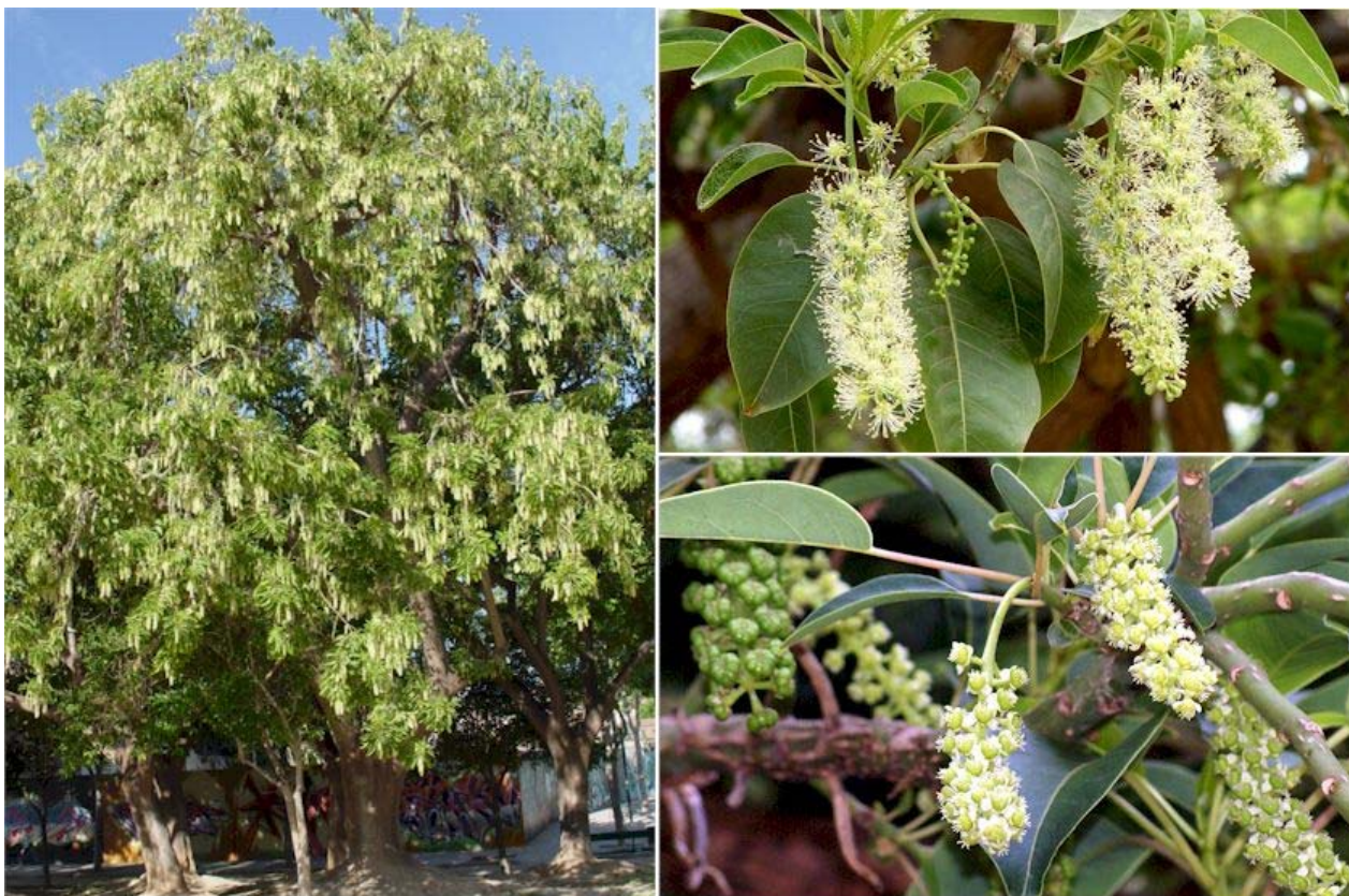
Aspecto general y detalle de las flores en Mayo. Las masculinas arriba y las femeninas abajo

Nombre común: ombú, bellasombra, fitolaca.